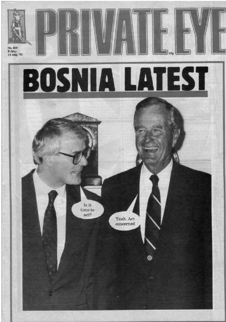
Naslovnica satiričnog časopisa Private Eye sa Londonske konferencije

Džon Mejdzor: „Je li vreme da delujemo?“