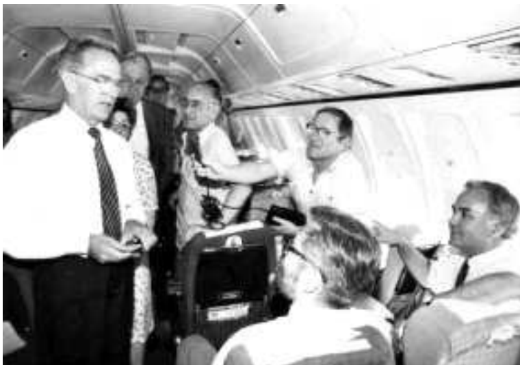
Milan Panić na diplomatskoj misiji u avionu Savezne vlade, u razgovoru sa novinarima Slavkom Ćuruvijom i Manojlom Vukotićem

Panićevoj retorici, međutim, manjka kredibilitet. Nedugo po njegovoj poseti Sarajevu, početkom avgusta, svet obilaze zastrašujući snimci nastali nakon poseta novinara logorima Omarska i Trnopolje početkom avgusta 1992. 17 Sednica Saveta bezbednosti hitno raspravlja o ovom pitanju i najoštrije osuđuje postojanje logora i praksu etničkog čišćenja. Nekoliko dana docnije, američki Senat podržava izjavu predsednika Buša kojom se pozivaju Ujedinjene nacije da stanu na kraj kršenjima ljudskih prava svim potrebnim sredstvima. Slično je intonirana i rezolucija 770 Saveta bezbednosti (13. avgusta) koja je odobrala preduzimanje svih neophodnih mera da se obezbedi dostava humanitarne pomoći ugroženim područjima na teritoriji Bosne i Hercegovine.