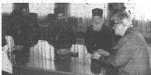
Добрица Ћосић у разговору са делегацијом СПЦ коју је предводио патријарх Павле