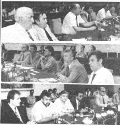
Са учесничког састана у Палати федерације