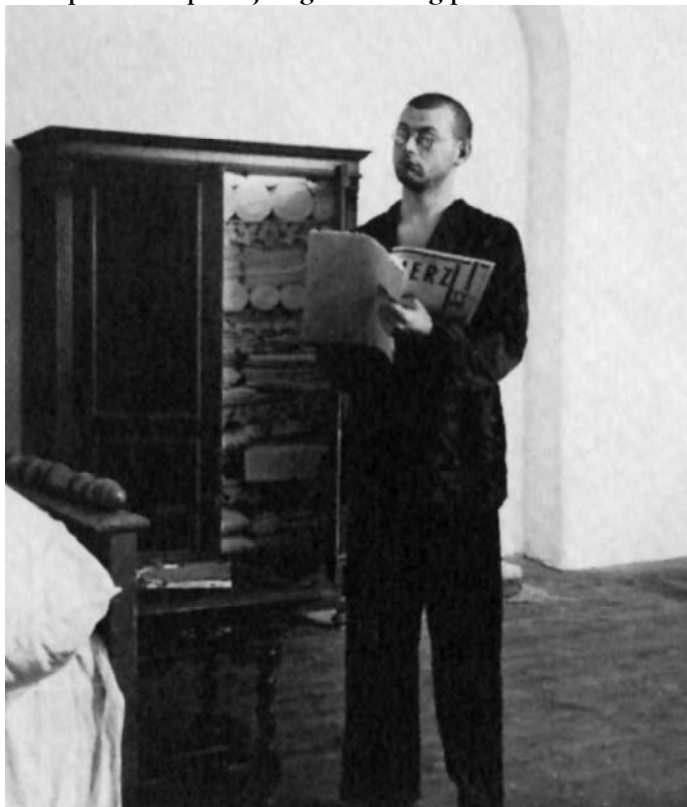
Sl. 12. Splav Meduze (Karlo Aćimović – Godina, 1980)

neophodnost koja proističe iz nepodnošljive, iscrpljujuće izvitoperenosti postojećeg fašističkog poretka. 3