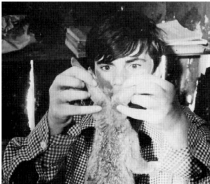
Sl. 19. Sjećaš li se, Dolly Bell? (Emir Kusturica, 1980)

nik, a ne tiranin. On nije patrijarhalni otac iz oksidentalnih antropoloških shema, već je autohtoni deo jedne drugačije baštine, baštine paganskog pretka svojstvene slovenskom, još tačnije – južnoslovenskom nasleđu . 4