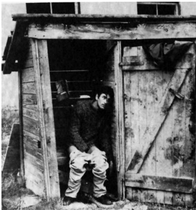
Sl. 7. Kad budem mrtav i beo (Živojin Pavlović, 1969)

Đavolji film je pun tvrdnji u kojima se očituje divljenje Ajzenštajnovoj genijalnosti: