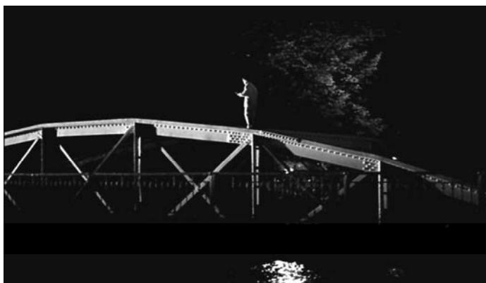
Sl. 18. Otac na službenom putu (Emir Kusturica, 1985)

mitivizmom. Film je nabijen emocijama, polušaljiv, a njegov nesnishodljiv odnos prema običnom svetu u Bosni u direktnoj je saglasnosti s pretenzijama ovog pokreta da prikaže svakodnevni život "malih ljudi" iz njihove vlastite, autonomne perspektive. Protagonista filma, pubertetlija Dino, njegova radnička porodica (koja živi u premalom, oronulom stanu), kao i njegovi prijatelji, sarajevski mangupi (neki od njih su deca palih partizanskih boraca), spadaju među najuspešnije kinematografski realizovane, prototipske likove po kojima su novoprimitivci obično modelirali svoje, svesno prenaplašene, junake i "zvezde."