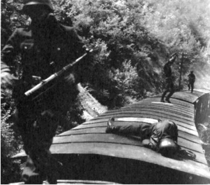
Sl. 15. Valter brani Sarajevo (Hajrudin Krvavac, 1971)

djevši kišu, prvo pomisli da će se popodnevni derbi između Želje i Veleža odigrati po veoma teškom i raskvašenom terenu." 7