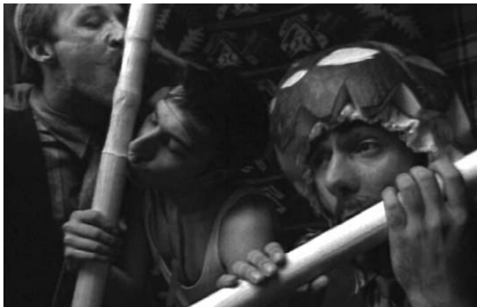
Sl. 17. Top lista nadrealista (TV serija, 1991)

svima dostupan, (demaskirani) falus više ne doprinosi održavanju već ukidanju Očevog zakona: "Postaje poluga [drvena poluga?] koja, u rukama ovog demona, nasrće na označeno i obeležava ga kao nezakoniti porod označavajućeg lanca". 30