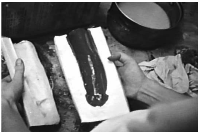
Sl. 3. WR: Misterije organizma (Dušan Makavejev, 1971)

slično polnom udu kada je sputan gipsanim okloпом – u razvoju sprečili, prerano zaustavili, autoritarizam i ideološka rigidnost njenih vođa, tih moćnih simboličnih (smrznutih i umrtvljenih, kako ističe sam Makavejev) falusa! 19