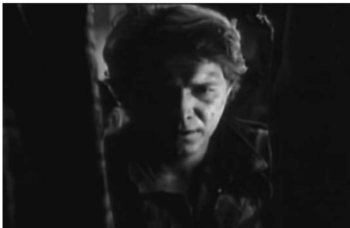
Sl. 28. Lepa sela lepo gore (Srdan Dragojević, 1996)