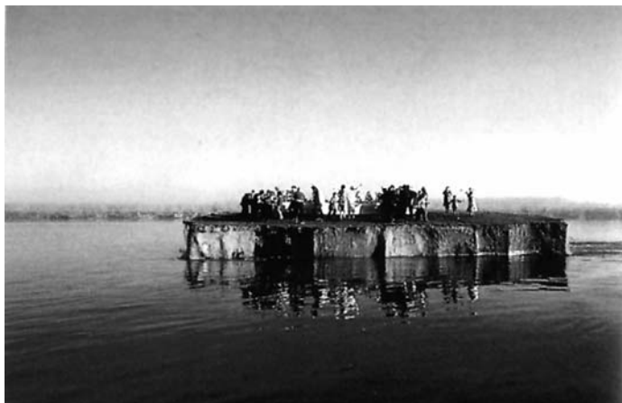
Sl. 22. Underground (Emir Kusturica, 1995)

Ovo slavljenje čistog, neokaljanog jugoslovenskog ideala – Kusturičina finalna "koreografija uživanja" (stilski pomalo nalik Vajdinom tretmanu "poljskog pitanja" u filmu Svadba iz 1972. godine) – zamišljeno je kao suprotstavljeno i u stanju je da prevaziđe savremene etnonacionalističke mržnje među Južnim Slovenima. Kao takvo, ono zahteva da ni po koju cenu ne bude pobrkano s onim što film, s druge strane, prikazuje kao istorijsku praksu ideološkog izopačenja i zagađenja jugoslovenskog ideala: njegovu političku zloupotrebu nakon Drugog svetskog rata, u Titovom socijalističkom režimu. Kako je Peter Krastev napisao o završnoj sceni filma: "To je ostrvo sreće, 'Jugoslavija idejâ', nasuprot 'mračnoj' (podzemnoj) Jugoslaviji, koja je lažna i puna obmana. To je 'prava stvar' za kojom svaki smrtnik u podzemnom svetu