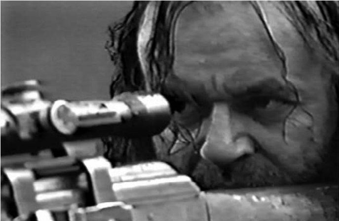
32. Poslije bitke (Muhamed Hadžimehmedović, 1997)