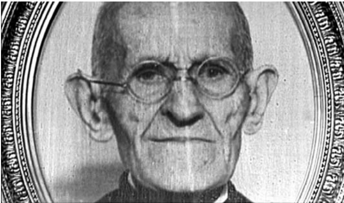
Sl. 14. Maratonci trče počasni krug (Slobodan Šijan, 1981)