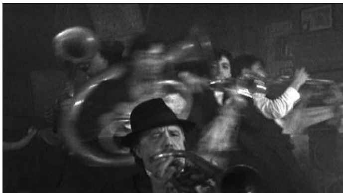
Sl. 21. Underground (Emir Kusturica, 1995)

njihova isprepletana tela počinju da se vrte oko ose koja se proteže od kamere do ravni akcije (sl. 20); i (b) vrteška ko-