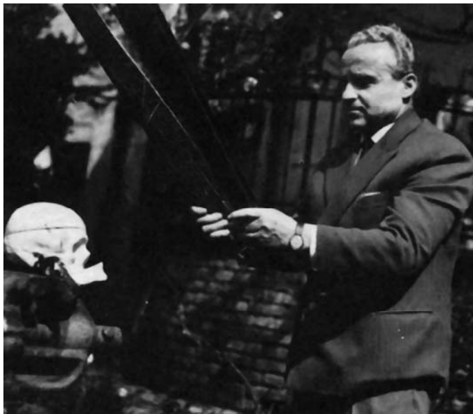
Sl. 2. Nevinost bez zaštite (Dušan Makavejev, 1968)

šću bez zaštite , njegovim trećim filmom, postalo je sasvim očigledno da je Dušan Makavejev jedan od najznačajnijih stvaralaca u domenu modernog filmskog kolaža.