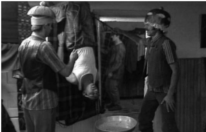
Sl. 16. Top lista nadrealista (TV serija, 1991)

sisanje motke! (Sl. 18) Moglo bi se, stoga, reći da očinska figura TLN -a odiše nekoordinisanim ali oslobađajućim uživanjem ( jouissance ), kojim se inficira čitava zajednica i koje najizrazitije težište svog otelotvorenja nalazi u motki – novoprimitivističkom ekvivalentu lakanovskog "demaskiranog falusa". 28 Ne označavajući društveno propisano odricanje i manjak uživanja već, naprotiv, obilje istog, motka kao falusno prisustvo priziva (u patrijarhalnim očima) ono što Lakan naziva "demonom stida". 29 "Demokratizovan" i