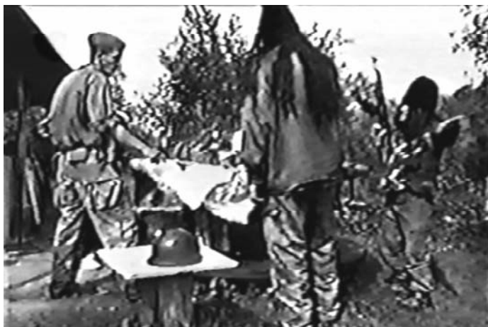
Sl. 25. U okruženju (Stjepan Sabljak, 1999)

ku onoga što radimo. Takve narative smo uvek-već "pozicionirali upravo kao pretpostavke." 17