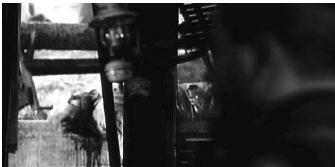
Sl. 29. Lepa sela lepo gore (Srdan Dragojević, 1996)

Ovo kratko pojavljivanje Čamilovog tela predstavlja jedini prekršaj u filmu samonametnute zabrane prikazivanja mrtvog etničkog drugog u toku akcija srpske vojske. Kao takav, ovaj jedinstveni slučaj transgresije ukazuje upravo na ono što inače, kao posledica nametnute zabrane, funkcioniše kao "nedostajuća sadržina" filma: ubijanje čiji su počinioci glavni junaci filma. Drugim rečima, u ovoj sceni susrećemo se s optičkom manifestacijom ideološke mrlje nacionalizma ; tu se otkriva vizuelni ekvivalent ranije pomenute "zvučne izmaglice," koju su tokom uličnih protesta 1996-1997. godine proizvodili demonstranti. Brzom promenom fokusa u kadru koji prikazuje Čamilovo mrtvo telo, skreće se pažnja na sâm postupak kojim se prikriva ekscenno ponašanje vojnika: vizuelno zamaglivanje, "mrljanje" slike omogućava da taj kompromitujući višak bude potisnut i da stabilnost i "normalnost" stvarnosti u kojoj vojnici žive i "rade" bude očuvana.