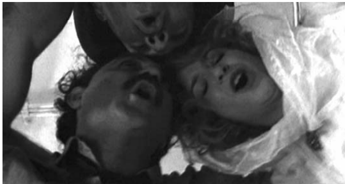
Sl. 20. Underground (Emir Kusturica, 1995)