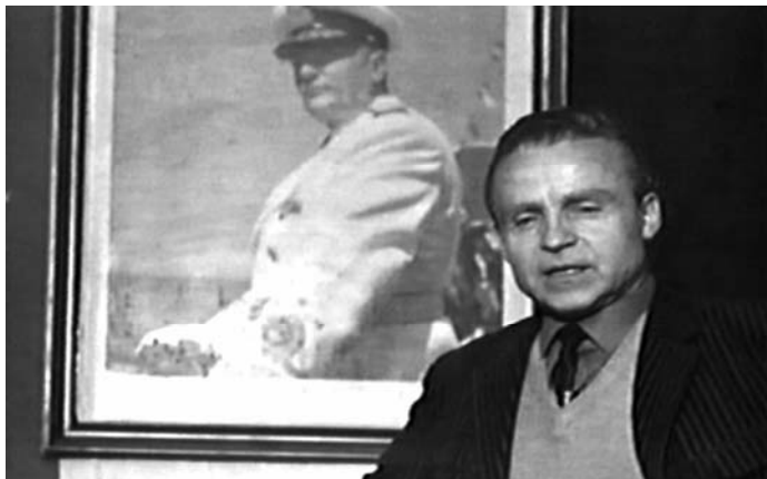
Sl. 9. Nevinost bez zaštite (Dušan Makavejev, 1968)