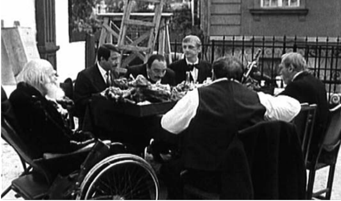
Sl. 13. Maratonci trče počasni krug (Slobodan Šijan, 1981)