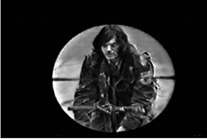
31. Poslije bitke (Muhamed Hadžimehmedović, 1997)