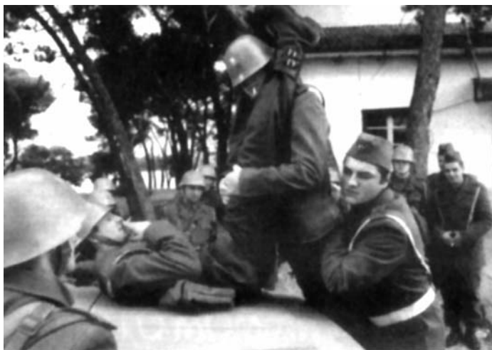
Sl. 26. Kako je počeo rat na mom otoku (Vinko Brešan, 1996)

pretvara da je srpski oficir, a drugi da je njegov posilni, Slovenac. Ovaj drugi zabavlja vojnike izmišljenim pričama o svojim švalerskim avanturama i čak uspeva da nagovori dvojicu vojnika, Crnogorca i Albanca, da "odglume" jedan od njegovih seksualnih podviga (Sl.26). Tako nastaje mala komična predstava, izvedena "iza kulisa" (van glavne bine), koja kao da je ponikla iz prebogate jugoslovenske tradicije vulgarnih etničkih viceva: "Hrvat koji se predstavlja kao Slovenac, natera Albanca da jebe Crnogorca."