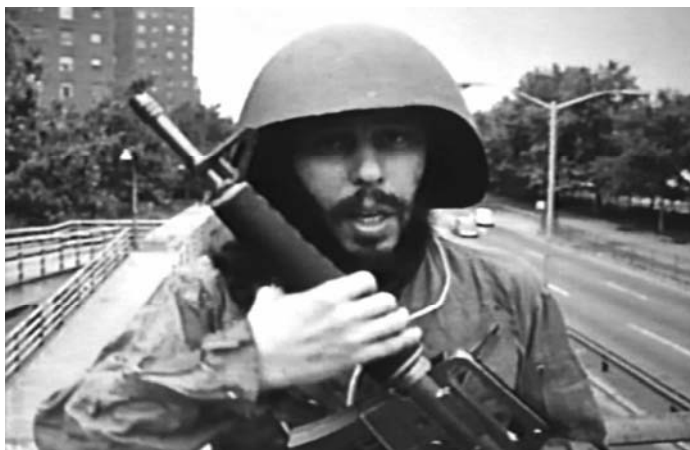
Sl. 5. WR: Misterije organizma (Dušan Makavejev, 1971)