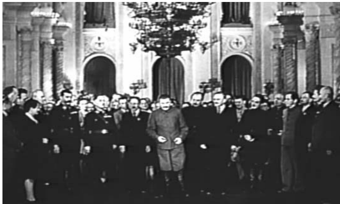
Sl. 4. WR: Misterije organizma (Dušan Makavejev, 1971)