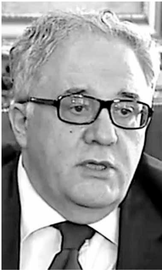
Novi predsjednik SANU, vodeći srpski neurolog i ugledni znanstvenik Vladimir Kostić