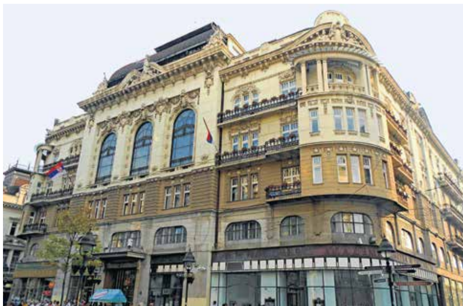
Zgrada Srpske akademije nauka i umjetnosti u beogradskoj Knez Mihajlovoj ulici

Povod je 30. godišnjica dokumenta vinovnika krvavog raspleta tijekom raspada Jugoslavije