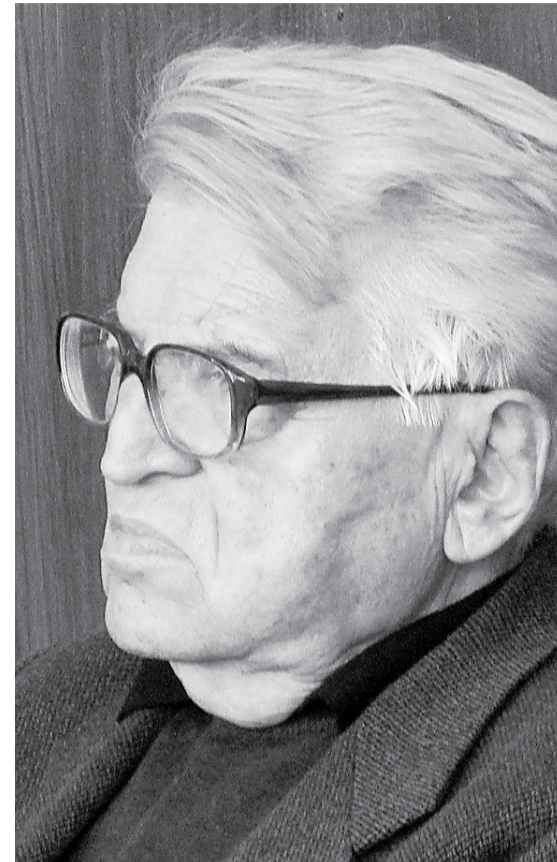
Dobrica Ćosić još je 1984. tražio da se SANU izjasni o potrebi angažiranja na nacionalnim problemima